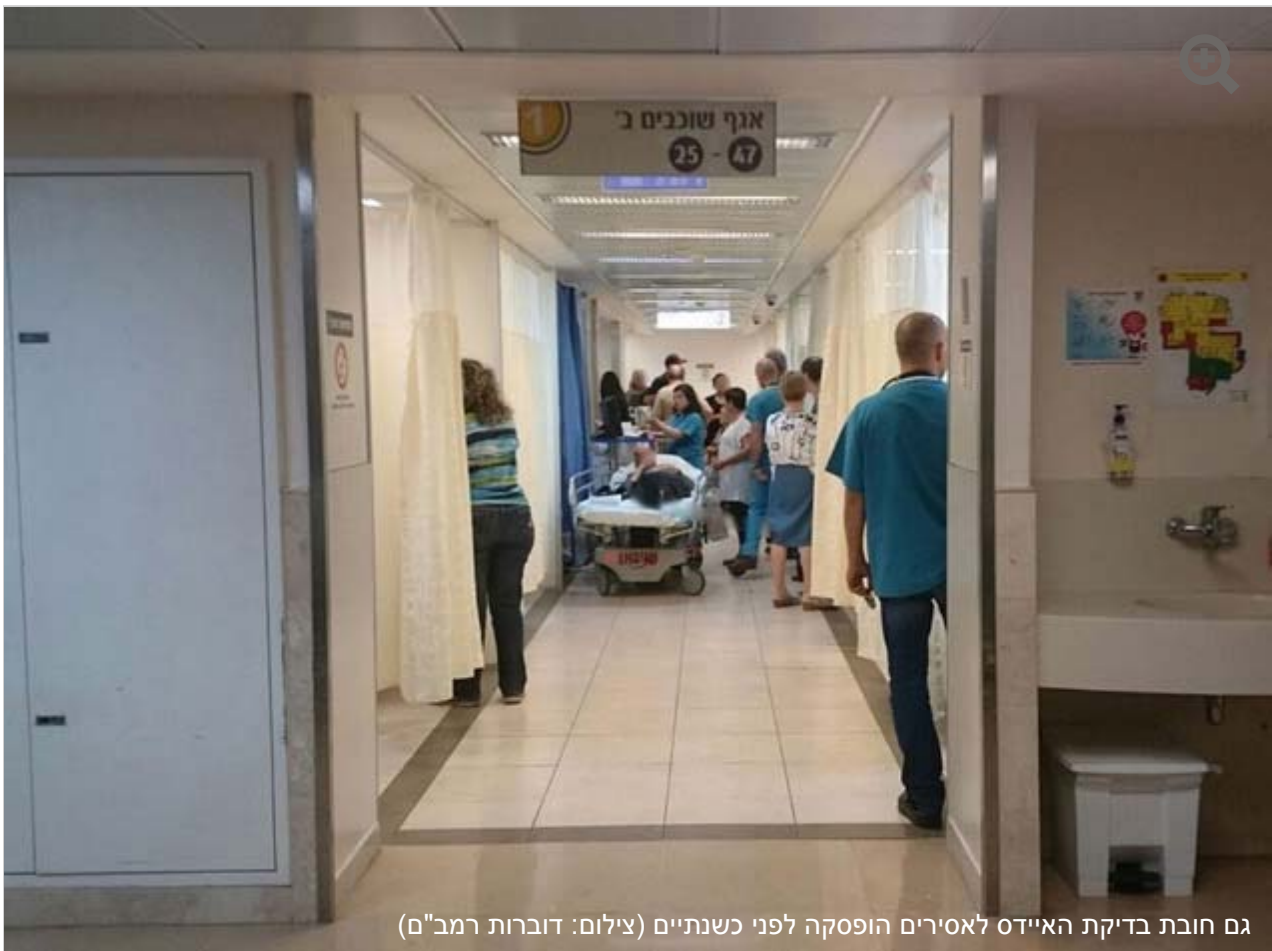
גם חובת בדיקת האיידס לאסירים הופסקה לפני כשנתיים

"בסוף 2013 שהו בבית סוהר 'צלמון' כ-970 כלואים, 344 מהם, כ-36%, הוגדרו חולים כרוניים. מדבריהם של מפקד בית הסוהר ורופא בית הסוהר עולה כי היכולת לתת שירות רפואי הולם היא מוגבלת, זאת עקב ריבוי החולים הכרוניים המשפיע לרעה על איכות הטיפול".