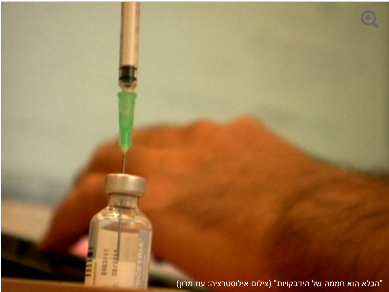
"הכלא הוא חממה של הידבקויות"