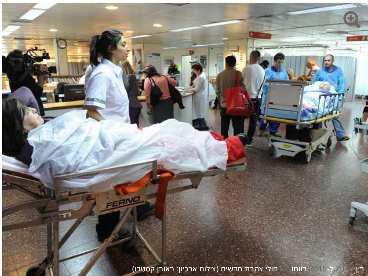
בין 2013 ל-2015 דווחו על חולי צהבת חדשים